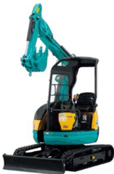
RX-205 CR 定格荷重 (標準アーム、0.06m 3 バケット付)