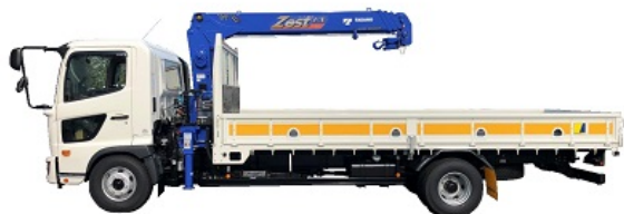
■作業範囲・揚程図