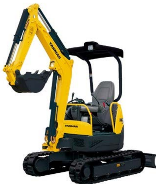
標準アーム、0.066m 3 バケット付、 バケット空荷状態