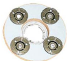
NO.2ダイヤモンドベース