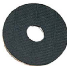
マジックパット台