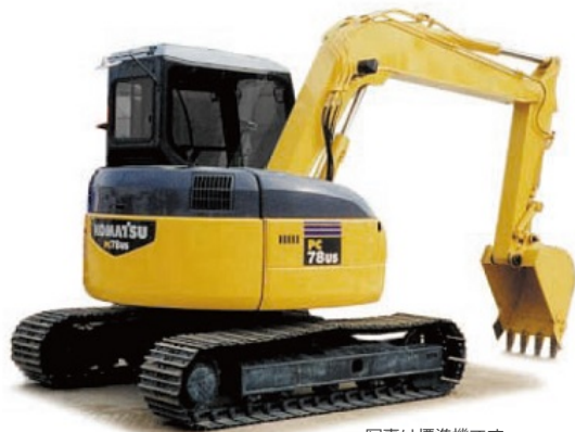
写真は標準機です。