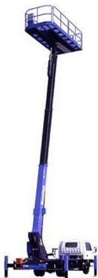
作業 アウトリガ最大張出